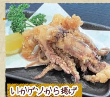
いかゲソから揚げ