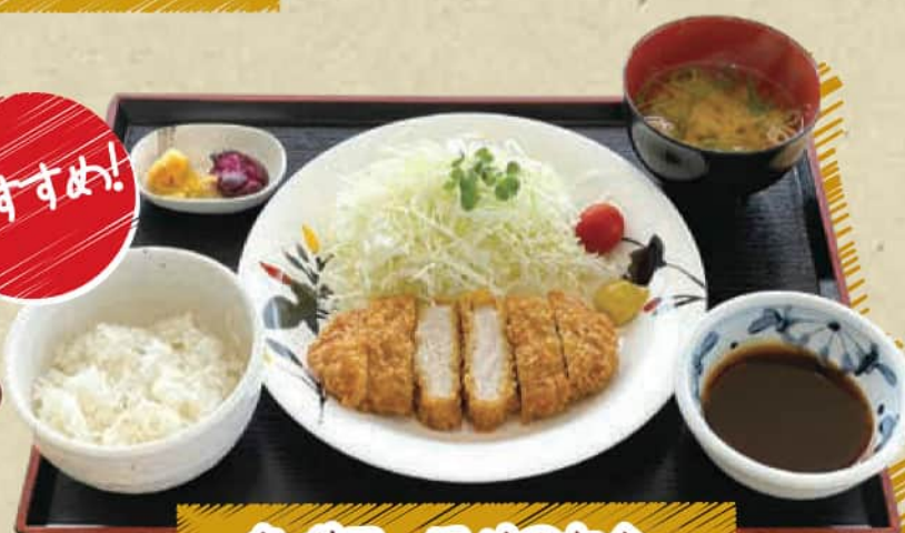
熟成ロースかつ定食

◆ご昼食券 + 400円 (税込 440円) ◆ご昼食券なし 1,200円 (税込 1,320円)