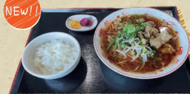
炭火焼き鶏ハラミラーメン

◆ご昼食券 + 100円 (税込 110円) ◆ご昼食券なし 900円 (税込 990円)