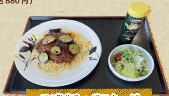
スパゲティボロネーゼ