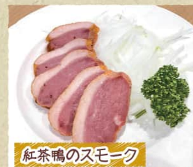
紅茶鴨のスモーク