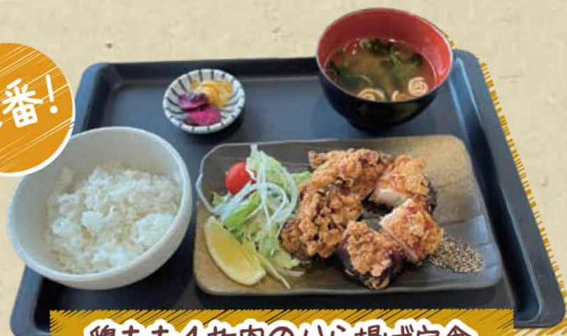
鶏もも1枚肉のから揚げ定食

◆ご昼食券 + 100円 (税込 110円) ◆ご昼食券なし 900円 (税込 990円)