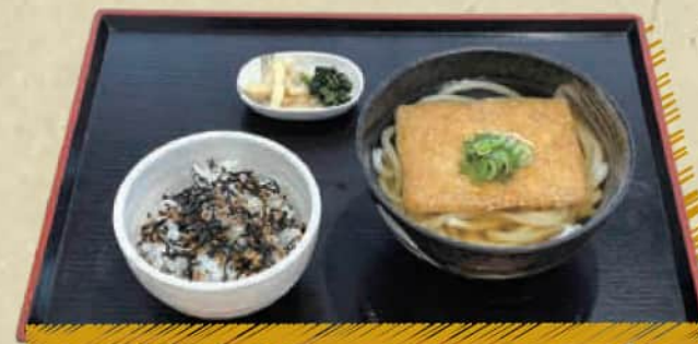
きつねうどん・そばとまぜご飯