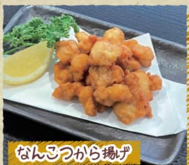
なんこつから揚げ