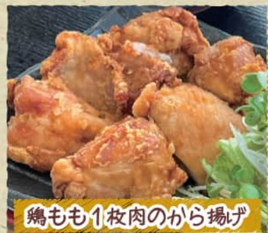
鶏もも1枚肉のから揚げ