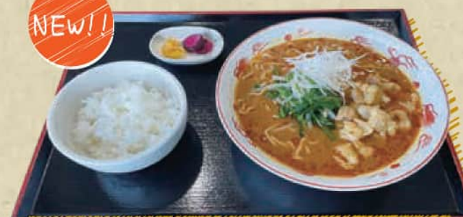
ピリ辛ホルモン味噌ラーメン

◆ご昼食券 + 200円 (税込 220円) ◆ご昼食券なし 1,000円 (税込 1,100円)